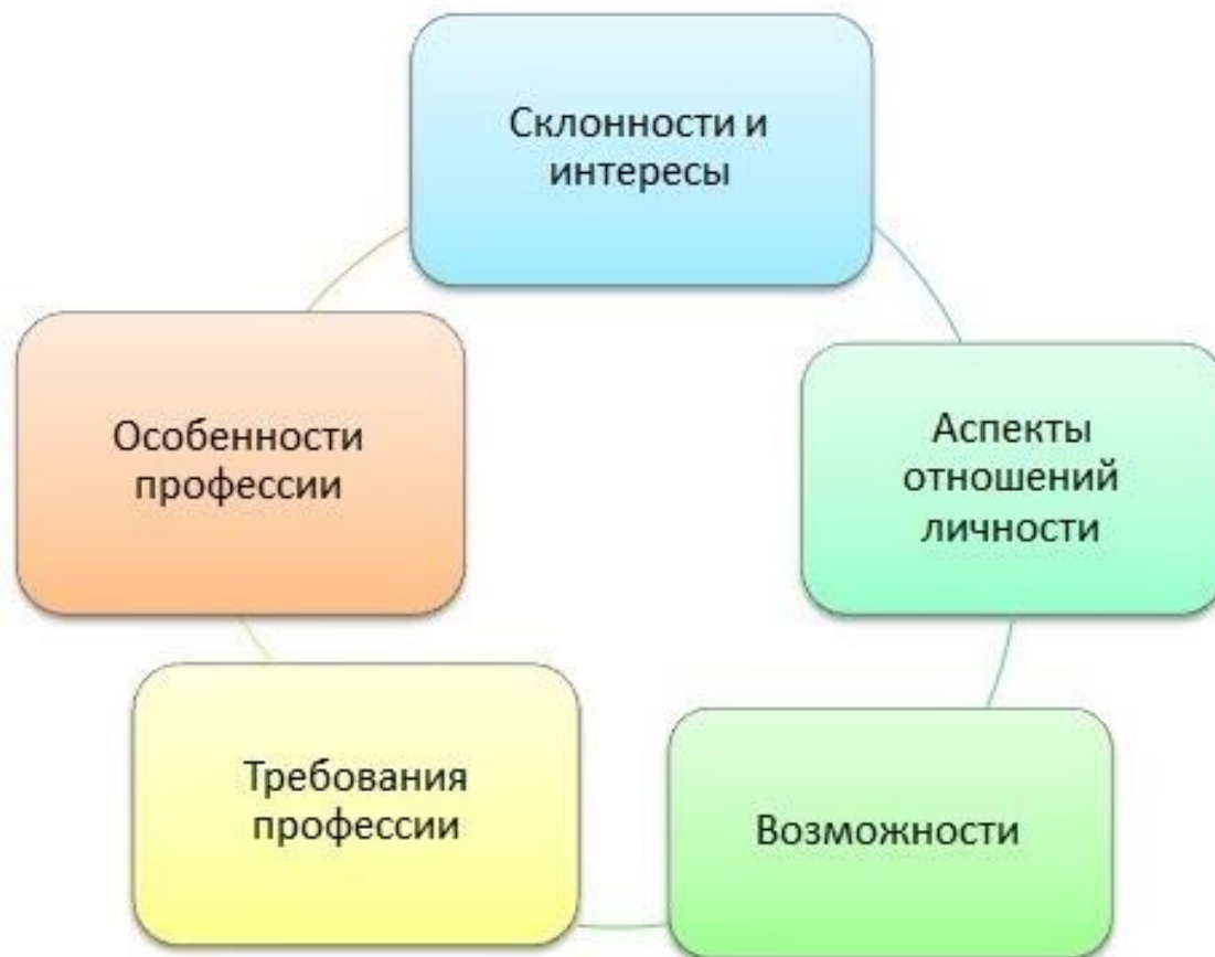
Схема профориентационной психолого-педагогической диагностики